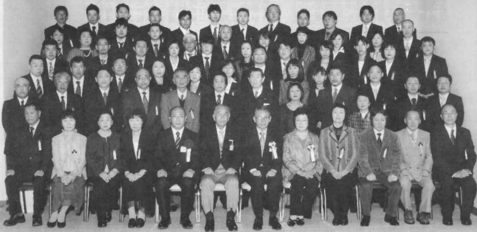
役員功勞表彰・商工業振興表彰・優良永年勤続表彰受賞の皆様