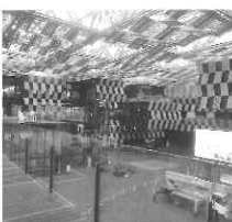
アオーレ長岡の屋根付広場の様子