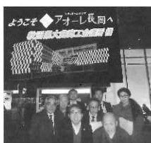
視察に参加された皆さん

込め開催され、その後被災地の復興を応援する花火として全国に知れ渡り、長岡のシンボル、そして市民の誇りとなつてきているそうです。二日目は、花火会場を視察しました。大曲との違いは、河川敷が狭い分、両岸を観覧席として使用している他、側にある陸上競技場なども有効活用していました。今回の視察では、お互いの花火への想いと誇りを再確認し、市民参加型の取組みには大いに刺激を受け、実りある研修となりました。