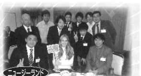
ニュージーランド