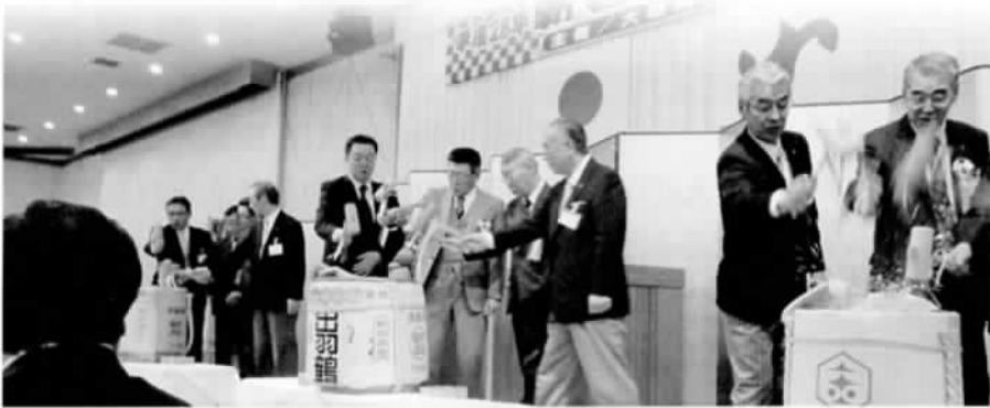
大仙市と会議所の更なる発展を願い鏡開き

いさつ(一〜二ページ掲載)の後、ご来賓の佐竹知事、栗林市長よりご祝辞、御法川衆議院議員のメッセージ披露、村岡衆議院議員、渡部県議会議員からスピーチをいただきました。