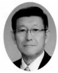
秋田県知事 佐竹 敬久