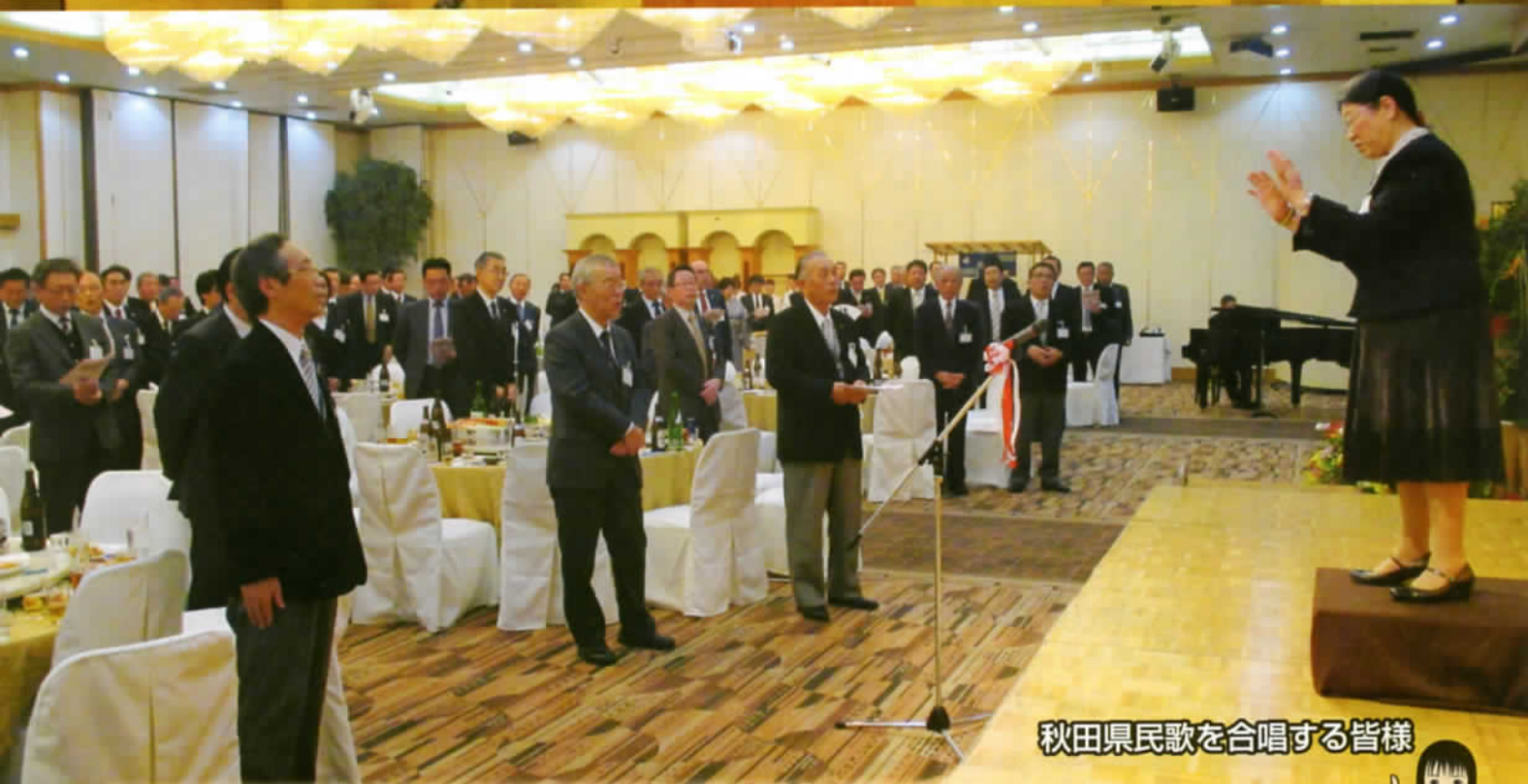
秋田県民歌を合唱する皆様