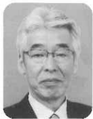
野実之 株式会社挽野飯金